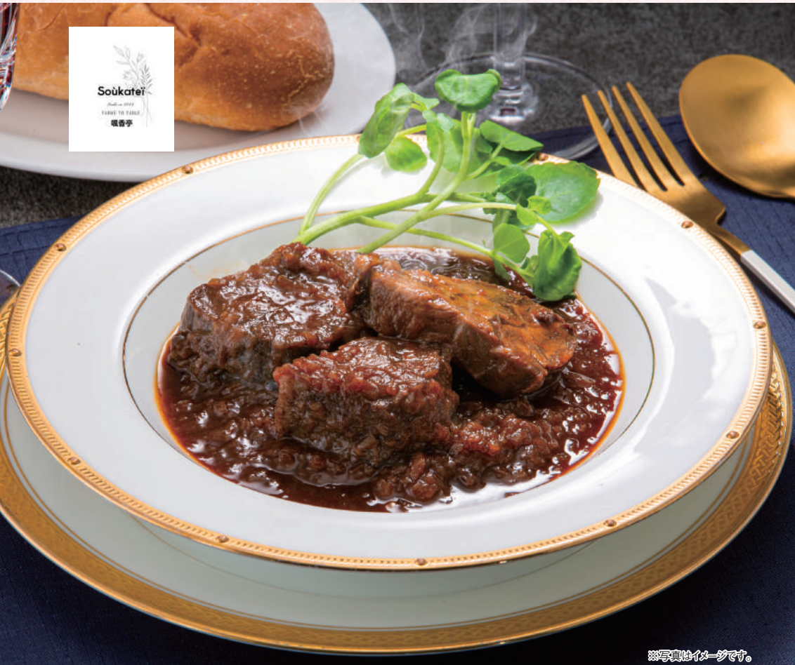
※写真真似イメージです。