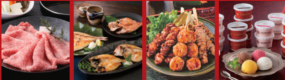
精肉・ハム・肉加工品 P.2~8 海鮮・水産加工品 P.9~12 惣菜・グロスアリー P.13~16 アイス P.17~18

あなた様のお好みに合わせたグルメを贈りたい。そんな贈り主様からのお心づかいを込めたカタログギフトです。バラエティ豊かなお品をご用意いたしましたので、お好きなものをお選びいただきお申し込みください。