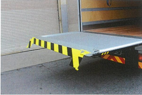
オートゲートストッパー使用時